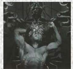
Gérald Hostenstein « Obsolescence # 1 »